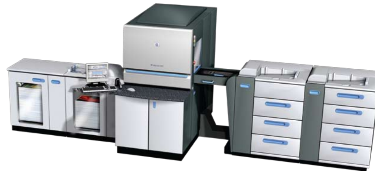
מכונת הדפוס HP Indigo press 5500 עם יחידת הזנת נייר שנייה אופציונלית, חיבור ליחידת הגימור HP Indigo UV Coater, ולערכת מצעי הדפסה עבים.